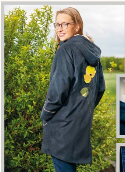
Gr. S-M-L-XL und auf Maß