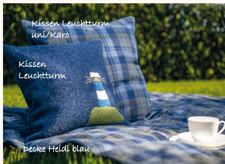
Kissen Leuchtturm uni/Karo