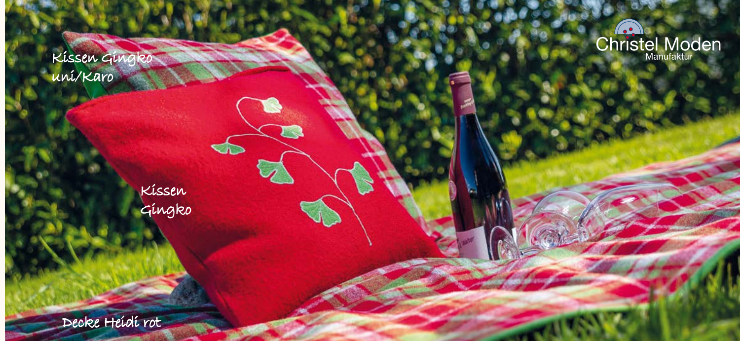
Kissen Gingko uni/Karo