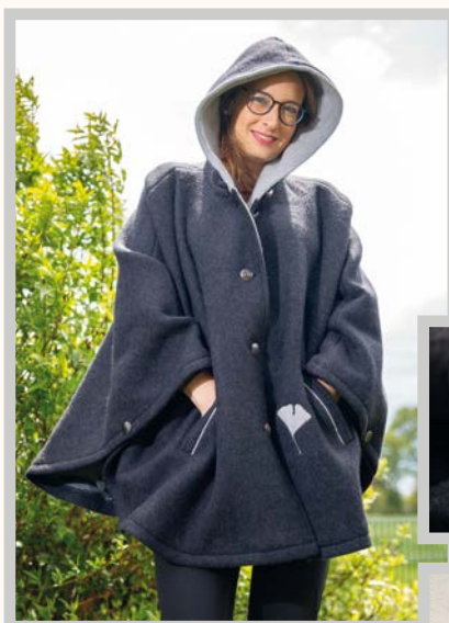
Gr. S-M-L-XL und auf Maß